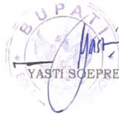
YASTI SOEPREDJO MOKOAGOW